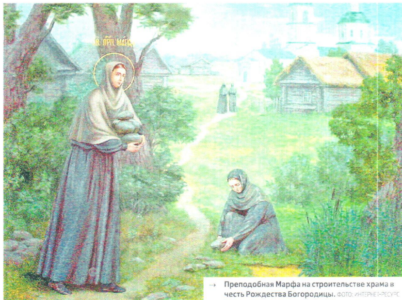
→ Преподобная Марфа на строительстве храма в честь Рождества Богородицы.

Однажды навестила родной дом Прасковья. Оказалось, что она идет по монастырским делам к батюшке Серафиму. Вот и стала Машенька проситься с ней